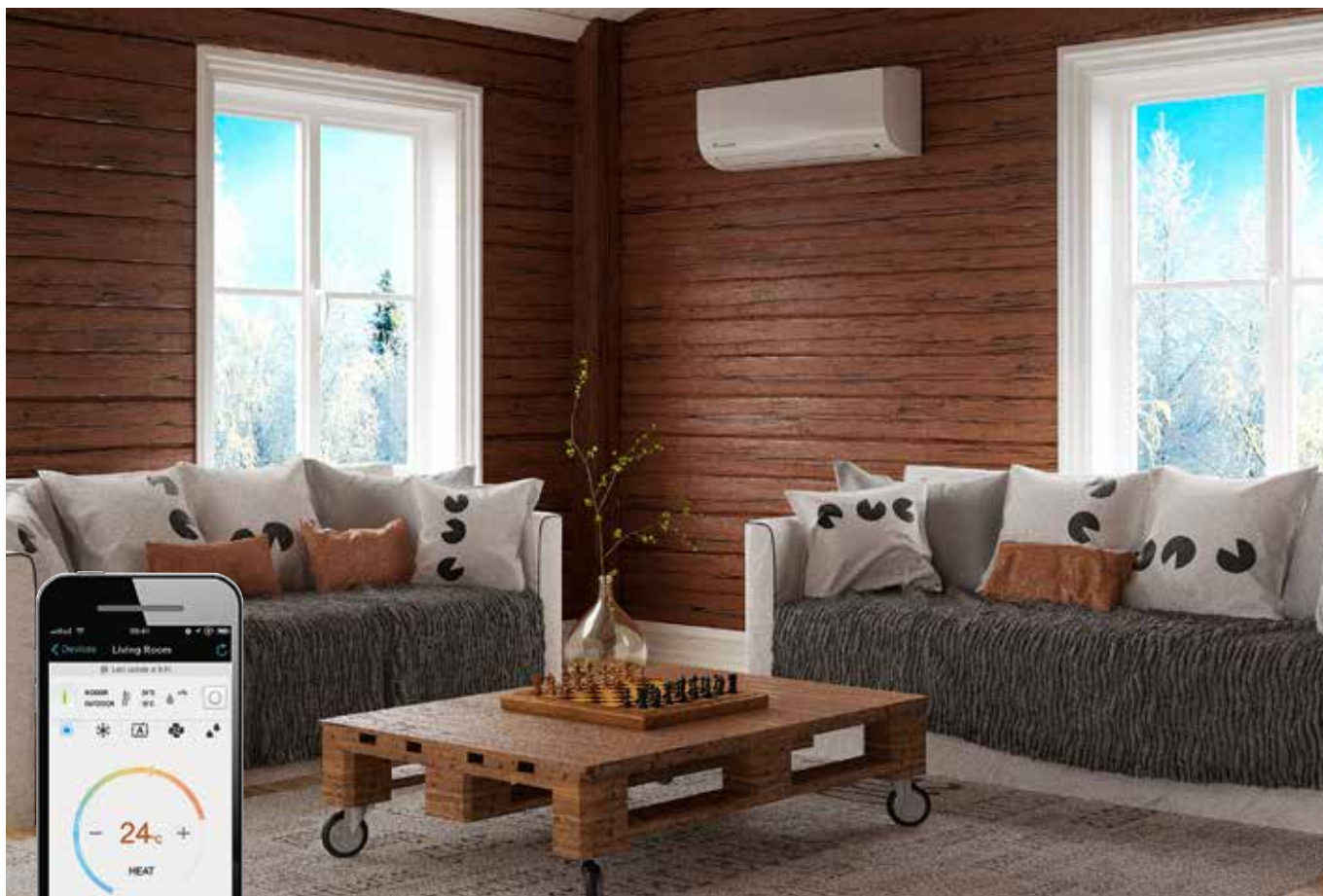
Daikin Comfora -ilmalämpöpumppu sopii hyvin myös mökin lämmitykseen ja peruslämmön ylläpitoon.